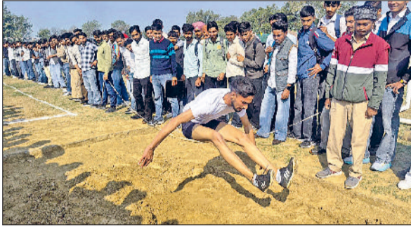
फतेहाबाद। एमएम कॉलेज में वार्षिक एथलेटिक मीट में भाग लेते खिलाड़ी तथा विजेताओं को सम्मानित करते प्राचार्य।

दिन भर चली इस मीट में विभिन्न ट्रैक एंड फील्ड स्पर्धाओं का आयोजन हुआ, जिसमें मुख्य