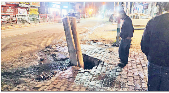
फतेहाबाद। जीटी रोड पर सीवरेज लाइन धंसने से बना गड्ढा।