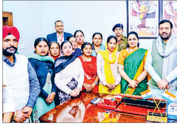
रतिया। चण्डीगढ़ में सीएम से मिलते रतिया पंचायत समिति के बगावती सदस्य।

करीब आधा घंटे चली गई बैठक में 16 सदस्यों ने प्रशासन द्वारा बैठक स्थगित करने पर रोष जताया। इस पर सीएम ने प्रशासनिक अधिकारियों से बातचीत कर 23 फरवरी को अविश्वास प्रस्ताव पर मीटिंग सिरे चढ़वाने का आश्वासन दिया। बता दें