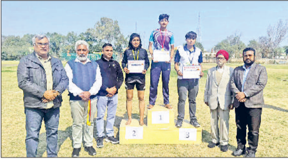
फतेहाबाद। एमएम कॉलेज में वार्षिक एथलेटिक मीट में भाग लेते खिलाड़ी तथा विजेताओं को सम्मानित करते प्राचार्य।