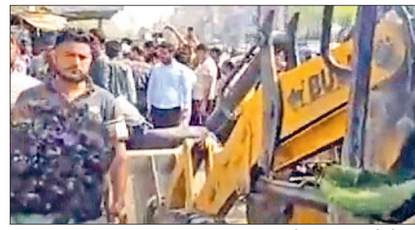
सिरसा। हिसार रोड पर अतिक्रमण हटाओ अभियान चलाती नगर परिषद की टीम।

समय उनके खिलाफ लाया गया अविश्वास प्रस्ताव रद्द हो गया था। तब खिलाफत करने वाले 12 सदस्य ही मीटिंग में पहुंचे थे, जबकि प्रस्ताव पास करने के लिए 15 सदस्यों की जरूरत थी।