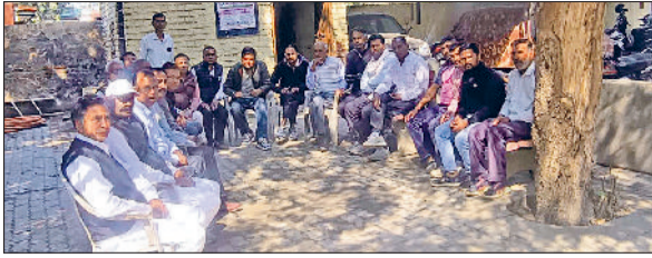
फतेहाबाद। बैठक में भाग लेते जनस्वास्थ्य विभाग के कर्मचारी।